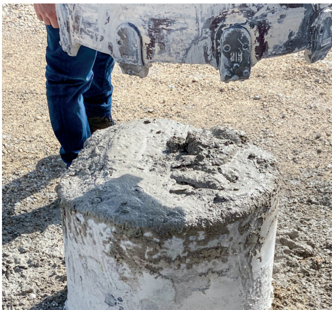
Test 1: Bewehrter Stahlbeton-Kern

Fels (176 MPa) Bohrfortschritt: 1,4 m/h und ca. 6 m mit einem Besatz WS 29-R