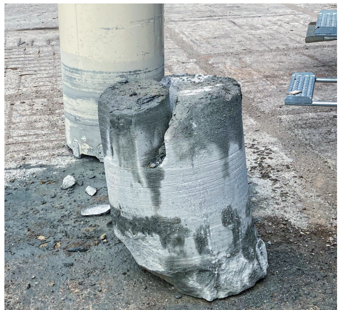
Test 2: Granit-Kern